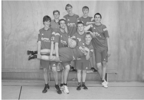
Abbildung 3: Die Männer der Verbands- und Regionalligamannschaften

Das diesjährige Prellballturnier fand am ersten Osterferienwochenende statt, was zur Folge hatte, dass nicht genügend Meldungen für die Jugendklassen eingingen. Somit wurde nur am Samstag in den Leistungs- und Freizeitklassen mit 13 Mannschaften gespielt. Der ATV Bonn belegte dabei die Plätze drei und sechs in der Leistungsklasse.