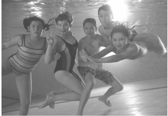
Abbildung 4: Die Kinder der Schwimmabteilung

Der Seepferdchenkurs ist immer sehr voll, was daran liegt, dass wir keine Wassergewöhnung anbieten können und so treffen im Schwimmbecken neue und alte Seepferdchenteilnehmer aufeinander, um ein Abzeichen zu erwerben.