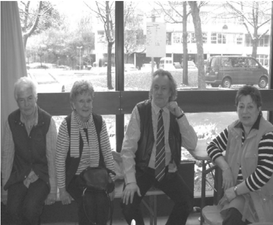
Abbildung 2: Die Gymnastikgruppe 50+ beim Prellball Turnier

So eine kleine Gemeinschaft macht aber noch mehr Spaß, wenn es über den reinen Zweck der Leibesertüchtigung und Geistauffrischung hinaus das eine oder andere "Zückerchen" in Form eines gemeinsamen Ausflugs (diesmal zur Straußenfarm nach Remagen) oder auch